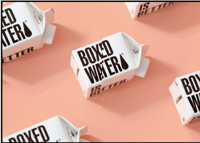
Druckergebnis ohne Bundversatz Im Bund verschwinden Motivinhalte