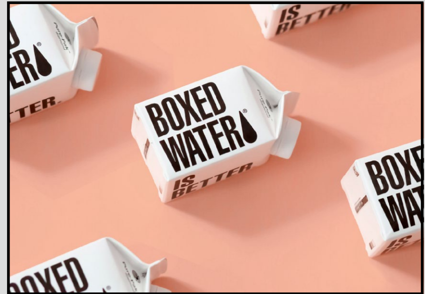
Druckergebnis mit Bundversatz Das Motiv ist vollständig zu sehen